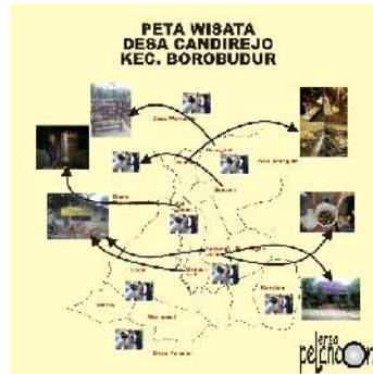
Gambar Peta dan Denah lokasi Desa Wisata Candirejo, Kabupaten Magelang

Desa Candirejo terbagi menjadi beberapa dusun, seperti 1) Dusun Pucungan, 2) Dusun Kaliduren, 3) Dusun Butuh, 5) Dusun Wonosari, 5) Dusun Ngangglik, 6) Dusun Brangkal, 7) Dusun Sangen, 8) Dusun Palihan, 9) Dusun Kedungombo, 10) Dusun Mangundadi, 11) Dusun Patran, 12) Dusun Judahan, 13) Dusun Cikal, 14) Dusun Kerten, 15) Dusun Kerekan. Dusun – dusun tersebut dipimpin oleh Kepala Desa dengan jumlah penduduk sebagai berikut :