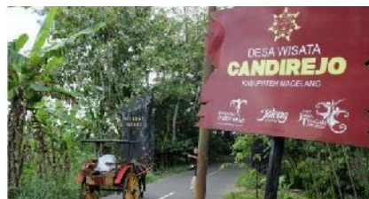
Gambar Jalan di Desa Wisata Candirejo Kabupaten Magelang