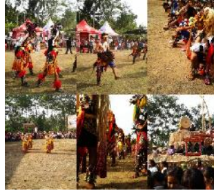
Gambar Kesenian Budaya Desa Wisata Candirejo oleh masyarakat