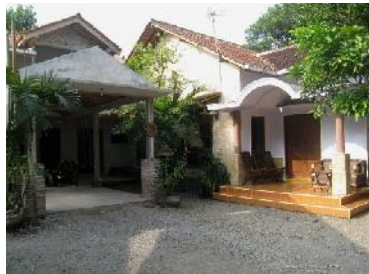
Gambar Homestay Tatak Dan Balai Desa Candirejo

Pengelola Homestay terkait lokasi Desa Wisata Candirejo Kabupaten Magelang terdiri dari profil Homestay pengelola dan pihak pengamat pariwisata dari Dinas Pariwisata, Kepemudaan Dan Olahraga. Sedangkan dari pihak wisatawan mancanegara adalah bagaimana peran dan kesan saat berkunjung di Desa Wisata Candirejo Kabupaten Magelang.