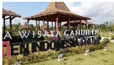
Gambar Homestay Tatak Dan Balai Desa Candirejo