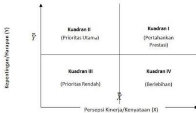
Gambar 1. Analisis Kuadran – Performance & Importance

Jika hasil analisis menunjukkan variabel berada dalam salah satu kuadran, interpretasi variabel tersebut disesuaikan dengan posisinya. Kuadran I menunjukkan faktor-faktor yang perlu dipertahankan prestasinya, karena dianggap penting oleh wisatawan dan implementasinya sudah sesuai dengan harapan mereka. Mengacu pada Gambar 1, Kuadran II merupakan wilayah di mana faktor-faktor tersebut dianggap penting namun belum mencapai kinerja yang diharapkan, menjadi prioritas utama. Kuadran III mencakup faktor-faktor dengan prioritas rendah, kurang penting bagi wisatawan dan kinerjanya tidak memuaskan. Sementara Kuadran IV adalah wilayah di mana faktor-faktor tersebut memiliki kinerja berlebihan, dianggap sudah baik oleh wisatawan, namun dianggap kurang prioritas.