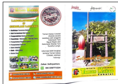
Gambar 3 Packaging Paket Edukasi Taman Kakao Cokelat