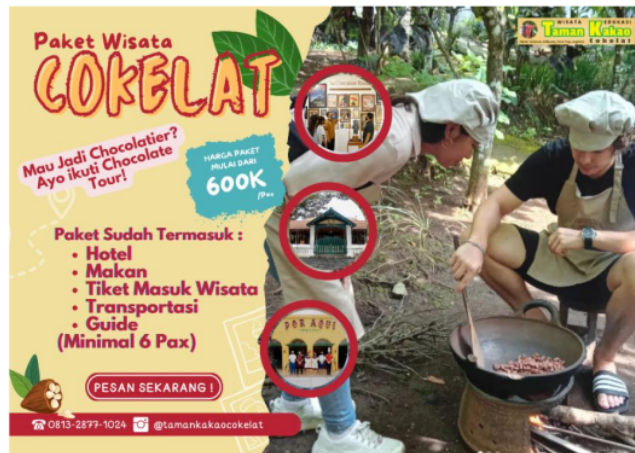
Gambar 4 Judul Paket Wisata

berhubungan dengan coklat. Sehingga muncul beberapa spot diantaranya Museum Cokelat, Restoran Meksiko dan Objek Warisan Budaya. Berikut hasil diskusinya: