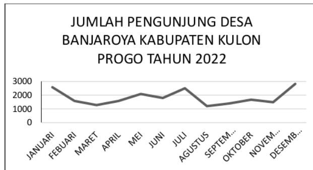
Gambar 1 Jumlah Pengunjung Desa Banjaroya Kabupaten Kulon Progo Tahun 2022