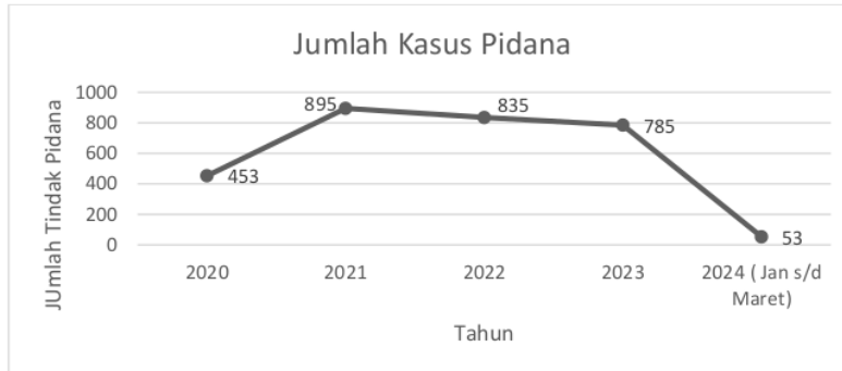
Gambar 1. Data diolah penulis berdasarkan interview pada tanggal 6 Mei 2024.

Berikut data tindak pidana yang diselesaikan melalui keadilan restoratif di Polresta Kupang dari tahun 2020-2024.