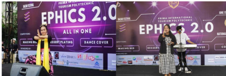
Gambar 9. Penampilan Peserta AMT ( Achievement Motivation Training ) EPHICS 2.0

Selanjutnya, sesuai rundown yang telah dibuat terdapat penampilan spesial dari Guest Star dalam memberi warna dan kesan meriah oleh SHIMMERVALE, merupakan Group Idol berasal dari Cirebon dimana mereka menggunakan konsep yang sama seperti JKT48. Dengan ditampilkannya SHIMMERVALE dapat menghasilkan kemeriahan dalam berlangsungnya acara, termasuk perhatian para peserta Cosplay & Coswalk .