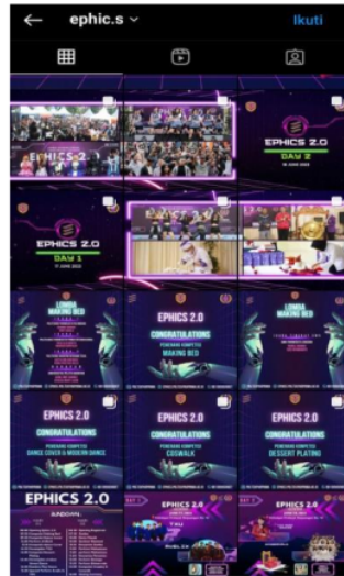
Gambar 11. Sosial Media EPHICS 2.0