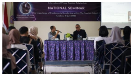
Gambar 7. Seminar Nasional EPHICS 2.0

Beranjak ke hari kedua acara EPHICS 2.0 dimulai dengan dibukanya registrasi untuk para partisipan Zumba di pagi hari. Selain bertujuan untuk memeriahkan acara, kegiatan Zumba juga meningkatkan semangat para partisipan dalam mengikuti kelangsungan acara. Adanya pemberian doorprize menghasilkan euphoria yang besar pada pembukaan acara EPHICS 2.0 di hari kedua.