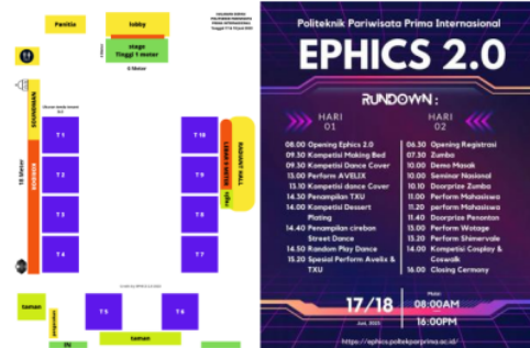
Gambar 1. Layout Acara dan Rundown Acara

dan berwirausaha, publikasi penyebaran flyer baik melalui media sosial maupun secara face to face .