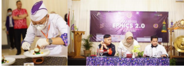
Gambar 6. Dessert Plating Competition EPHICS 2.0

dalam memberikan pelayanan prima, yang meliputi ketelitian dan kecepatan serta kreativitas mahasiswa dalam mendekorasi kamar.