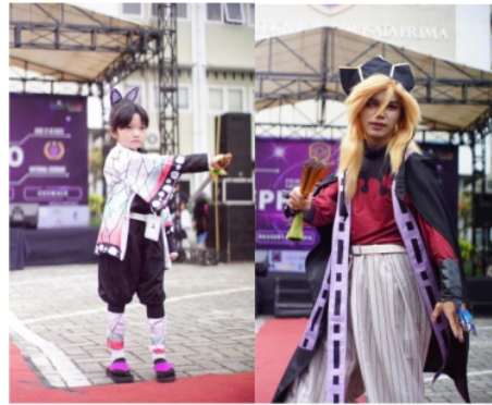
Gambar 10. Cosplay & Coswalk Competition EPHICS 2.0

EPHICS 2.0 hari kedua lebih beragam. Berlanjut dengan diperkenalkannya para juri lomba Cosplay & Coswalk , guna mendukung dan mengevaluasi peserta sebagai acuan dalam menentukan pemenang lomba. Dengan berlangsungnya acara EPHICS 2.0 hari kedua mampu memberikan daya tarik kepada massa, sehingga acara dapat berjalan secara meriah.