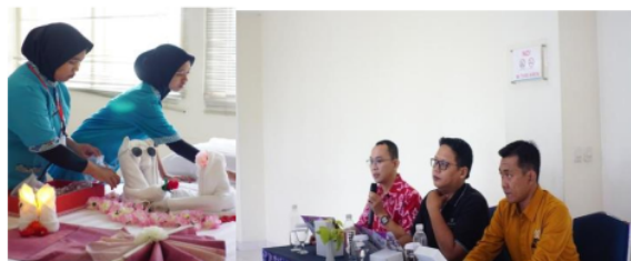
Gambar 5. Making Bed Competition EPHICS 2.0

Pelaksanaan Modern Dance Competition sebagai pembuka rangkaian lomba pada EPHICS 2.0 dimeriahkan dengan Special Performance TXU & AVELIX dan juga penampilan oleh Cirebon Street Dance. Tingginya minat masyarakat dalam dunia K-pop dan modern dance menjadi alasan utama Modern Dance Competition dilaksanakan. Making Bed dan Dessert Plating Competition menjadi highlight atau sorotan utama pada acara EPHICS 2.0 hari pertama. Adanya kaitan dengan kualitas pelayanan dalam industri perhotelan menjadi aspek penting bagi pariwisata Isrososiawan et al., (2020), Kanah et al., (2019), Mailangkay et al., (2021). Kompetisi-kompetisi yang diadakan bertujuan mengasah keterampilan mahasiswa serta menjadi tolak ukur sejauh mana kreativitas mahasiswa berkembang terutama dalam Bidang Studi Pariwisata dan Perhotelan.