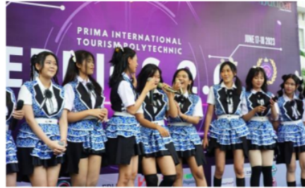
Gambar 8. Penampilan SHIMMERVALE EPHICS 2.0