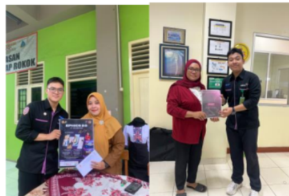
Gambar 2. Penyebaran flyer dan sponsorship EPHICS

Pada gambar 1. terdapat layout secara umum yang bertempat di Radiant Hall (Aula) Politeknik Pariwisata Prima Internasional. Dalam tahap ini mahasiswa berperan aktif dalam pembuatan layout . Kreativitas dalam penyusunan tata letak untuk mendapatkan kesan estetika dan ketelitian dalam pengukuran menjadi tolak ukur kemampuan mahasiswa/i dalam proses perencanaan acara. Dalam pelaksanaannya, kegiatan EPHICS 2.0 dilaksanakan pada akhir semester genap, dilakukan sebagai penutup tahun ajaran yang dilakukan setelah kegiatan akademik berlangsung. Acara EPHICS 2.0 dilaksanakan selama dua hari yang terdiri dari rangkaian kegiatan seperti: Dessert Plating Competition, Making Bed Competition, Dance Cover Competition , serta Cosplay & Coswalk Competition . Selanjutnya pada proses sosialisasi penyebaran flyer dan proposal sponsorship dilampirkan gambar sebagai berikut: