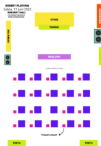
Gambar 3. Layout Dessert Plating Competition EPHICS 2.0

On Event yang merupakan bagian dari tiga tahapan penting dalam menyelenggarakan event dimana proses pelaksanaan berlangsung di hari yang telah ditentukan, sesuai dengan rundown yang telah disusun, yakni dimulai dengan kegiatan Open Ceremony dan diakhiri dengan kegiatan Cosplay & Coswalk Competition .