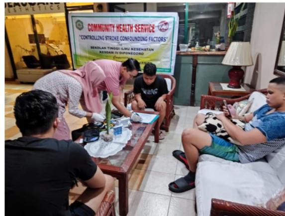
Gambar 4. Peserta Pengabdian Masyarakat melakukan Pemeriksaan Gula Darah