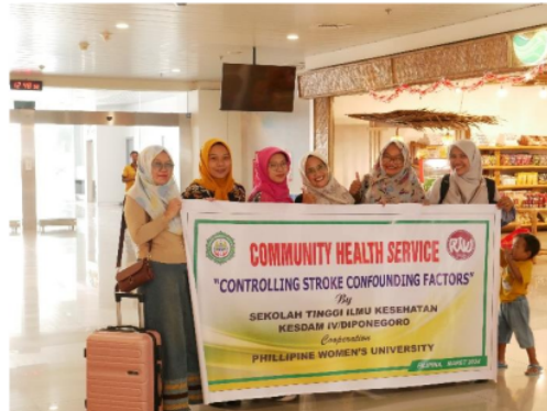
Gambar 1. Keberangkatan menuju Phillipine