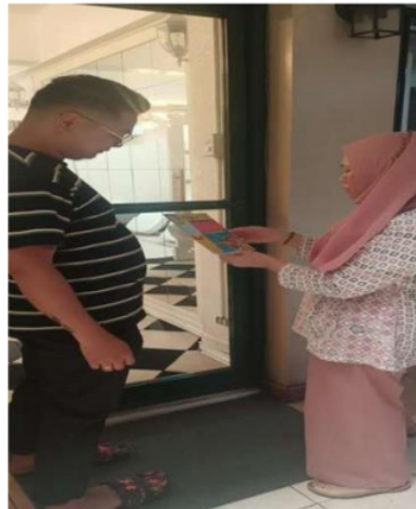
Gambar 6. Penjelasan Materi dan Pemberian Poster Kepada peserta

Berdasarkan hasil wawancara saat pelaksanaan pengabdian masyarakat usia penghuni LBB Mabini Apartelle, Manila mulai dari remaja usia \geq 17 tahun hingga lansia. Satu orang penghuni mengatakan pernah dirawat di rumah sakit dengan diagnosa stroke saat berumur 24 tahun dan saat ini masih mengonsumsi obat pengontrol tekanan darah, serta melakukan steam cell. Adapun hasil Pelaksanaan screening tekanan darah, gula darah, dan kolesterol adalah seperti dalam tabel dibawah ini.