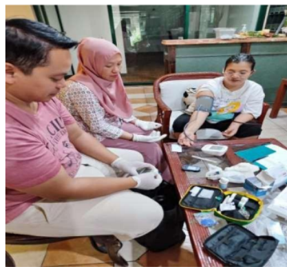
Gambar 3. Peserta Pengabdian Masyarakat melakukan Pemeriksaan Tekanan Darah