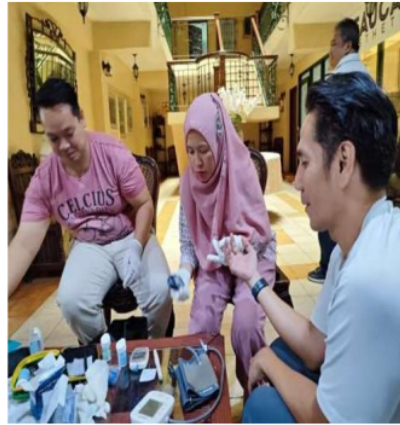
Gambar 5. Peserta Pengabdian Masyarakat melakukan Pemeriksaan Kolesterol