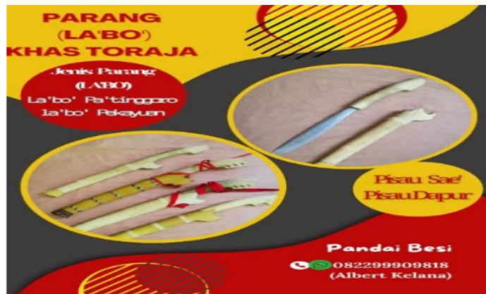
Gambar 3. Promosi yang dilakukan di instagram