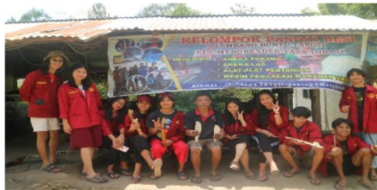
Gambar 1. Foto Bersama dengan kelompok Pandai Besi