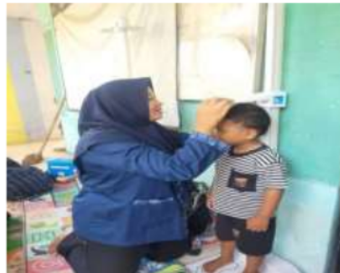
Gambar 2. Pengukuran berat badan dan tinggi badan