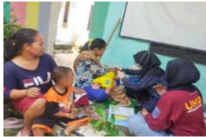
Gambar 2. Pemberian imunisasi

Setelah penyampaian materi oleh narasumber, masuk dalam sesi tanya jawab yang berupa penyampaian pertanyaan oleh peserta penyuluhan stunting. Diantaranya pertanyaan berupa apabila seorang ibu dengan kondisi stunting apakah anaknya juga akan stunting, kemudian seorang anak yang dilahirkan dengan kondisi normal tetapi ibunya setelah melahirkan meninggal lalu bagaimana cara untuk menghindari terjadinya stunting, kemudian yang dimaksud dengan gizi makro dan mikro. Selanjutnya, setelah sesi tanya jawab berakhir masuk ke dalam sesi penutup dari penyuluhan stunting. Pada sesi penutup, penyuluhan di tutup dengan membaca doa, foto bersama bersama dan terakhir dilanjutkan dengan kegiatan posyandu seperti penimbangan, pemberian imunisasi dan lain-lain.