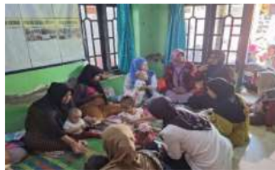
Gambar 4. Foto bersama dengan para kader posyandu dan Ibu-Ibu peserta penyuluhan