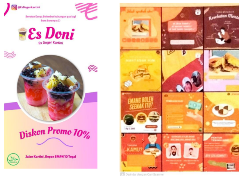
Gambar 1. Contoh Konten Media Sosial