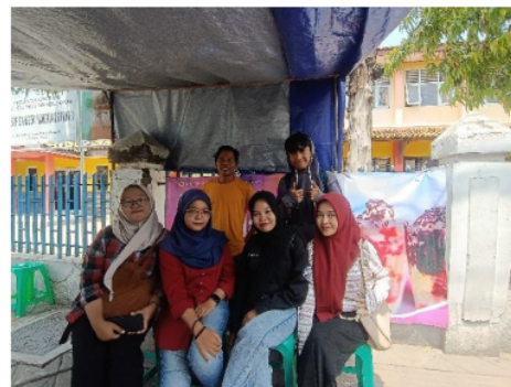
Gambar 2. Mahasiswa dengan mitra