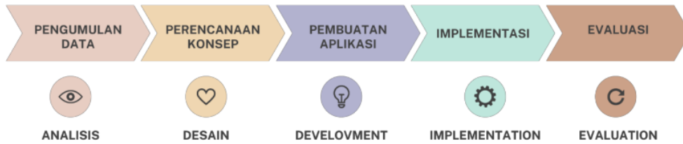
Gambar 2.1. Tahapan Rancang Bangun Aplikasi