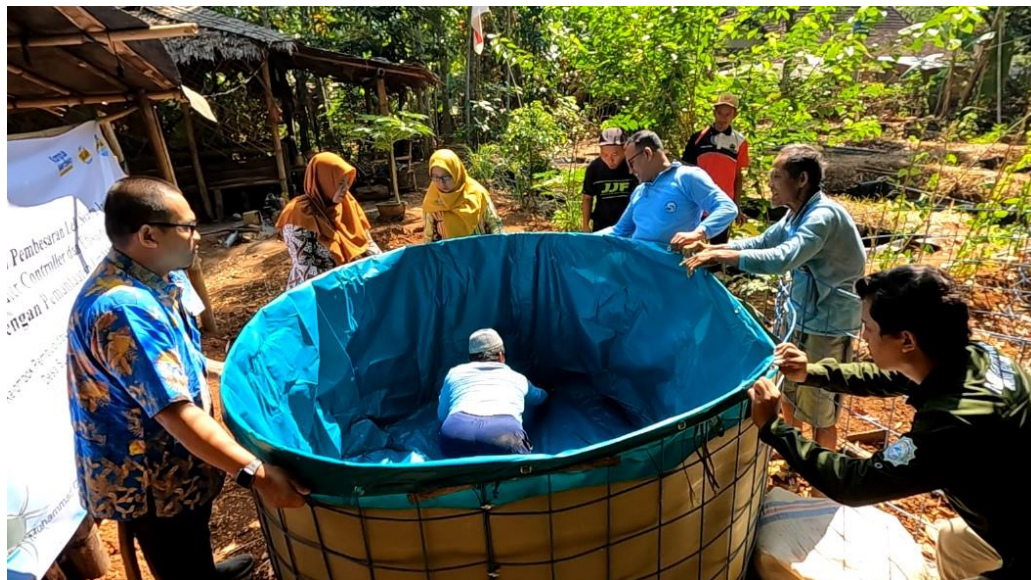
Gambar 5. Foto Pemasangan Kolam Bundar

Penggunaan kolam bundar berbahan terpal menjadi solusi dalam menyelesaikan permasalahan mitra. Kegiatan pemasangan kolam bundar ini dilakukan bersama-sama tim dan mitra. Dengan pemasangan kolam bundar sebagai pengganti kolam tanah diharapkan akan meningkatkan produktivitas dari mitra.