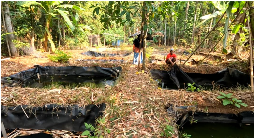
Gambar 2. Kondisi Lokasi Awal

Hasil observasi awal, kelompok pembudidaya ikan tawar (POKDAKAN) Suko Raharjo, dalam melakukan kegiatan budidaya lele masih menggunakan wadah pemeliharaan kolam tanah yang di atasnya dilapisi plastik bekas tambak garam, dimana memiliki beberapa kekurangan yaitu kolam jenis ini mudah rusak, lebih sulit dibersihkan, kotoran dan sisa pakan lele mudah menempel pada tanah dan plastik, sehingga kolam menjadi kotor dan berbau. Hal ini dapat menyebabkan penyakit pada ikan dan mengganggu kualitas air kolam. Kolam tanah yang di atasnya dilapisi plastik bekas tambak garam tidak ideal untuk pengaturan kualitas air. Sehingga dapat menyebabkan stres pada ikan dan mengganggu pertumbuhannya. Oleh karena itu, penggunaan wadah budidaya yang lebih kokoh, tahan lama, dan mudah dibersihkan, seperti terpal kolam khusus, sangat dianjurkan untuk budidaya ikan yang lebih optimal dan efisien.