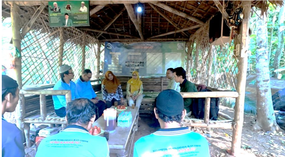
Gambar 3. Sosialisasi Kegiatan

menjadi solusi bagi masalah yang ada. Kegiatan ini penting dilakukan untuk menyamakan visi dari seluruh anggota yaitu tim PKM dan Mitra.