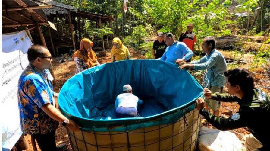
Gambar 5. Foto Pemasangan Kolam Bundar

permasalahan mitra. Kegiatan pemasangan kolam bundar ini dilakukan bersama-sama tim dan mitra. Dengan pemasangan kolam bundar sebagai pengganti kolam tanah diharapkan akan meningkatkan produktivitas dari mitra.