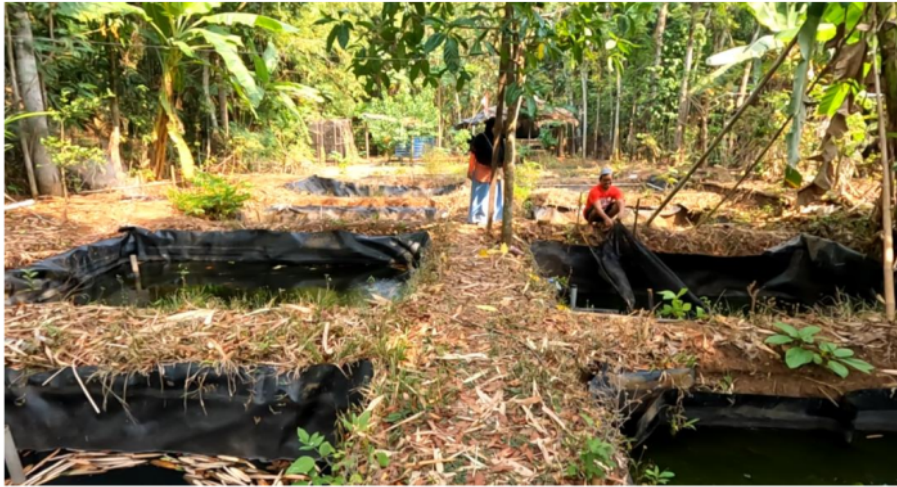
Gambar 2. Kondisi Lokasi Awal

Hasil observasi awal, kelompok pembudidaya ikan tawar (POKDAKAN) Suko Raharjo, dalam melakukan kegiatan budidaya lele masih menggunakan wadah pemeliharaan kolam tanah yang di atasnya dilapisi plastik bekas tambak garam, dimana memiliki beberapa kekurangan yaitu kolam jenis ini mudah rusak, lebih sulit dibersihkan, kotoran dan sisa pakan lele mudah menempel pada tanah dan plastik, sehingga kolam menjadi kotor dan berbau. Hal ini dapat menyebabkan penyakit pada ikan dan mengganggu kualitas air kolam. Kolam tanah yang di atasnya dilapisi plastik bekas tambak garam tidak ideal untuk pengaturan kualitas air. Sehingga dapat menyebabkan stres pada ikan dan mengganggu pertumbuhannya. Oleh karena itu, penggunaan wadah budidaya yang lebih kokoh, tahan lama, dan mudah dibersihkan, seperti terpal kolam khusus, sangat dianjurkan untuk budidaya ikan yang lebih optimal dan efisien.