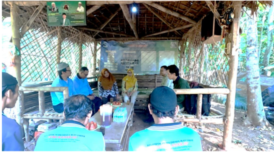
Gambar 3. Sosialisasi Kegiatan