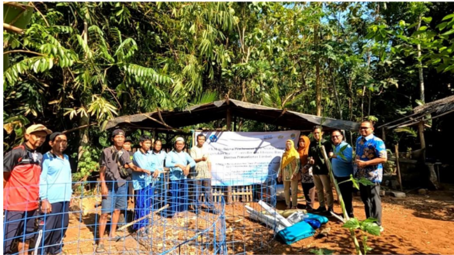
Gambar 4. Foto Penyerahan Kolam Bundar

Belanja material untuk pembuatan kolam bundar yang dilakukan oleh tim PKM yaitu melakukan pembelian 3 set kolam bundar berbahan terpal yang siap pasang. Rangka kolam bundar berbahan besi ulir 8 mm, dengan diameter 2D atau 2meter. Sebagai dasar landasan kolam karpet talang, dan terpal orchid sebagai bahan kolam bundar. Belanja bibit lele dengan ukuran 5 – 7 sejumlah 6.000 ekor.