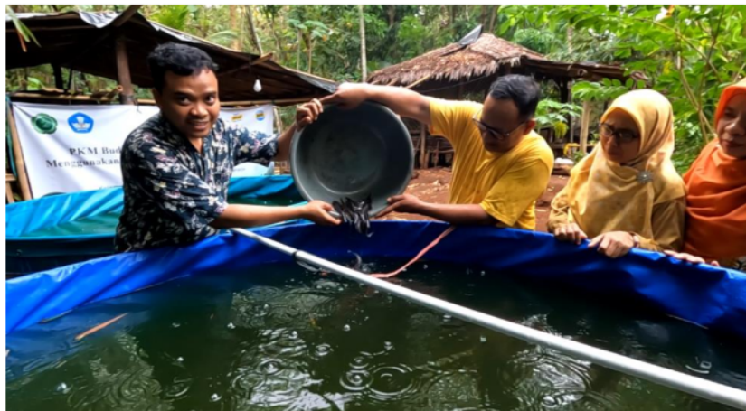
Gambar 6. Penebaran Bibit Lele

Penyerahan bibit lele oleh tim PKM kepada mitra dilakukan saat kondisi air pada kolam bundar telah siap. Penebaran bibit lele sejumlah 6.000 ekor dilakukan 1 periode.