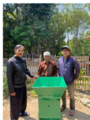
Gambar 1. Serah terima alat pencacah rumput oleh Dosen Pembimbing Lapangan kepada Kepala Desa Mekar Agung.

Secara keseluruhan, kegiatan ini berhasil mencapai tujuan yang telah ditetapkan dan memberikan manfaat nyata bagi masyarakat Desa Mekar Agung. Diharapkan kegiatan serupa dapat dilakukan di daerah lain dengan penyesuaian yang diperlukan agar dampaknya dapat dirasakan lebih luas. Upaya pengabdian masyarakat yang melibatkan teknologi sederhana seperti alat pencacah rumput ini dapat menjadi contoh dalam meningkatkan praktik pertanian berkelanjutan di Indonesia.