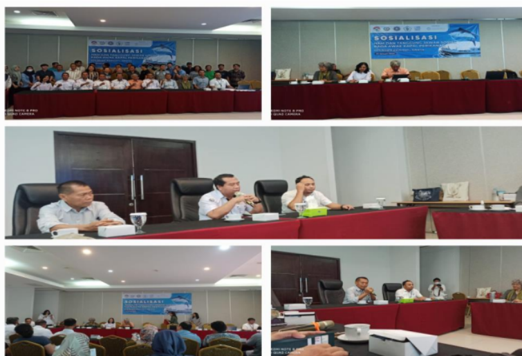
Pelatihan Sosialisasi HAM , Kolaborasi Direktorat Jenderal Perikanan Tangkap, Kementerian kelautan dan Perikanan, 2023

maritim. Misalnya, advokat dapat memberikan pendampingan dalam penyelesaian sengketa antara awak kapal dan majikan mereka. Selanjutnya, pada tahun 2021, perlindungan dan advokasi mencakup 40% awak kapal, menunjukkan adanya upaya yang lebih besar dalam memastikan keadilan bagi para pekerja di sektor kelautan dan Perikanan. Contohnya, program advokasi dapat memberikan pelatihan hukum kepada awak kapal agar mereka dapat memahami hak-hak mereka dengan lebih baik. Pada tahun 2022, persentase awak kapal yang mendapatkan advokasi dan perlindungan meningkat menjadi 45%, menunjukkan progres yang signifikan dalam memberikan perlindungan hukum bagi para pekerja di sektor kelautan. Misalnya, advokat dapat membantu awak kapal dalam proses klaim asuransi atau penyelesaian kontrak kerja. Terakhir, di tahun 2023, diharapkan mencapai target sebesar 50% awak kapal yang mendapatkan perlindungan hukum dan advokasi. Hal ini akan menjadi pencapaian yang luar biasa dalam memastikan keadilan dan perlindungan bagi para pekerja di sektor maritim. Misalnya, dengan adanya akses yang lebih luas terhadap advokasi, awak kapal dapat melaporkan kasus pelanggaran hak mereka dengan lebih percaya diri.